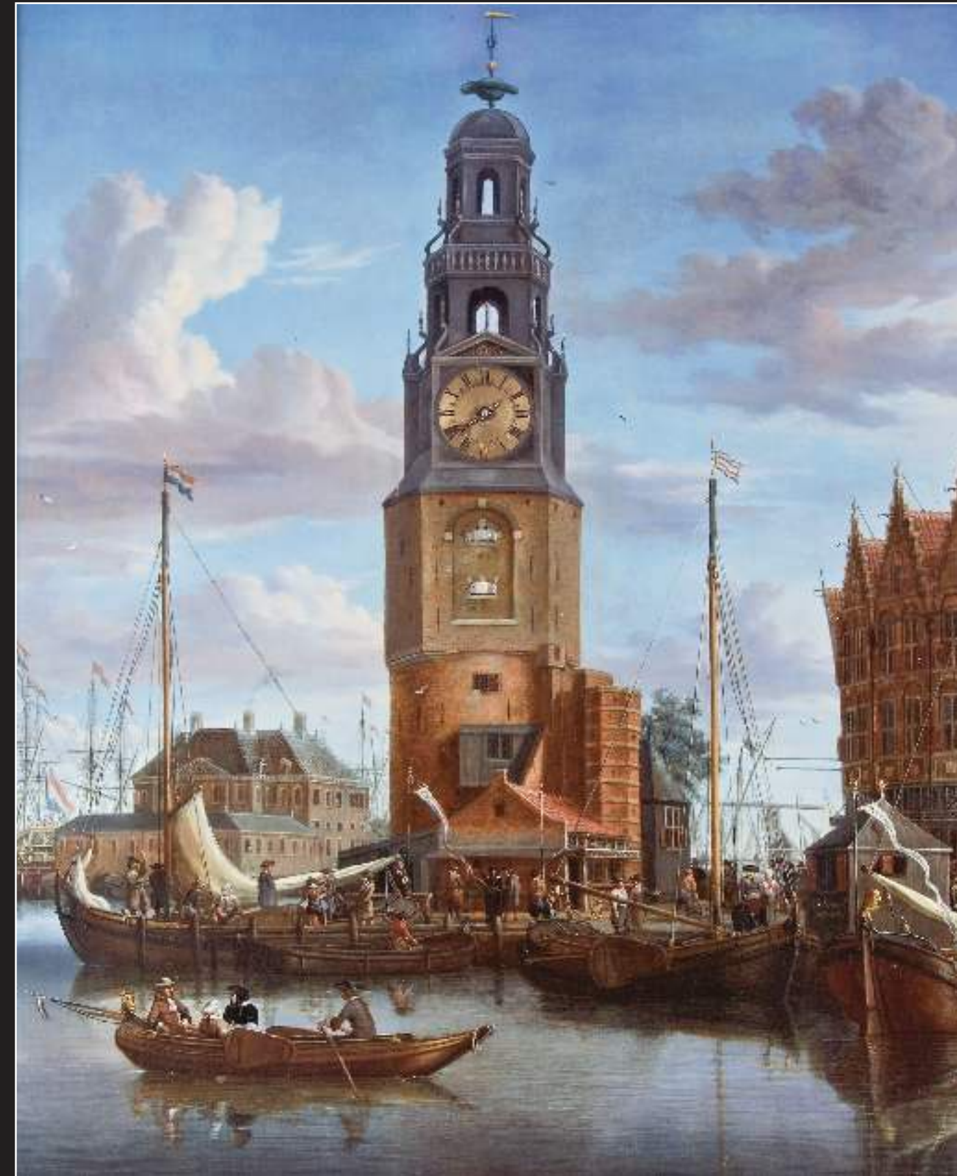
Dutch Old Master Marine Paintings, Drawings & Prints