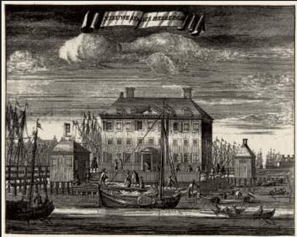
Gravure uit Casparus Commelin's beschrijving van Amsterdam, uitg. 1726