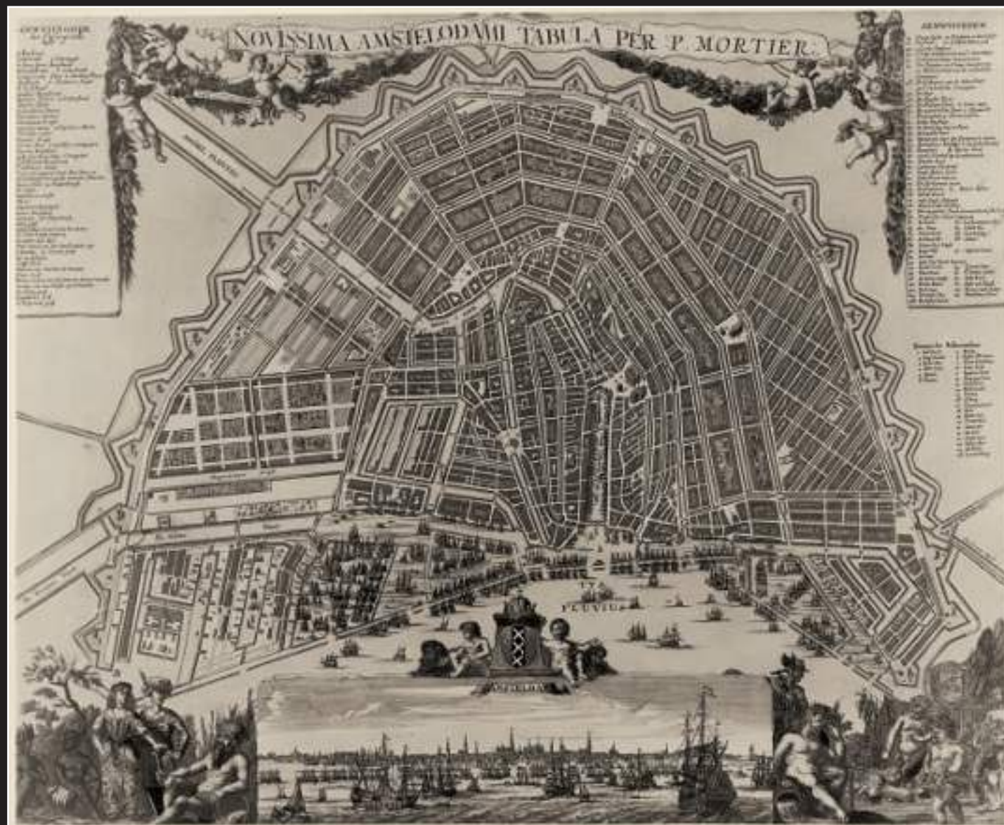
Novissima Amstelodami Tabula per P. Mortier Amsterdam 1692