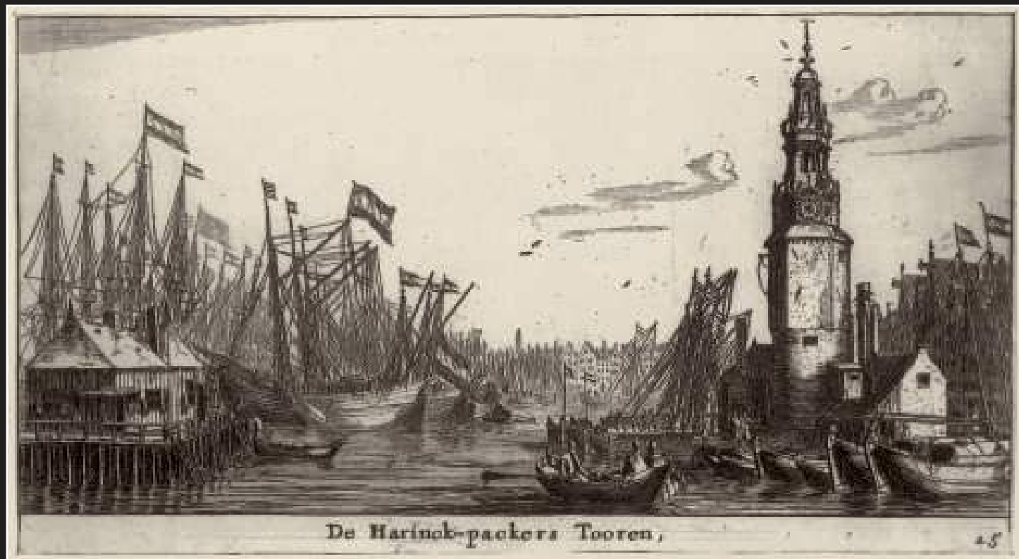
Ets Reinier Nooms, alias Zeeman (Amsterdam 1623 of 1624 - 1664)