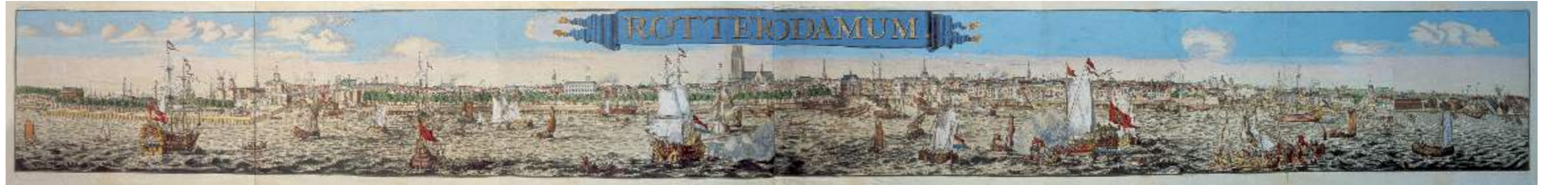
ROTTERODAMUM, profiel van de stad Rotterdam. Johannes de Vou en Romeyn de Hooghe 1694, ets over 4 bladen. Het meest linkse blad is in 1778 opnieuw geëts en vergroot.

Op het ijs geheel links twee tonnen gemerkt met drie ringen. Mogelijk dat het schilderij een opdrachtstuk voor de eigenaar van de Brouwerij was.