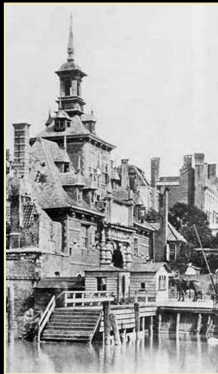
De Oude Ooster Hoofdpoort. Foto door Turing, 1856