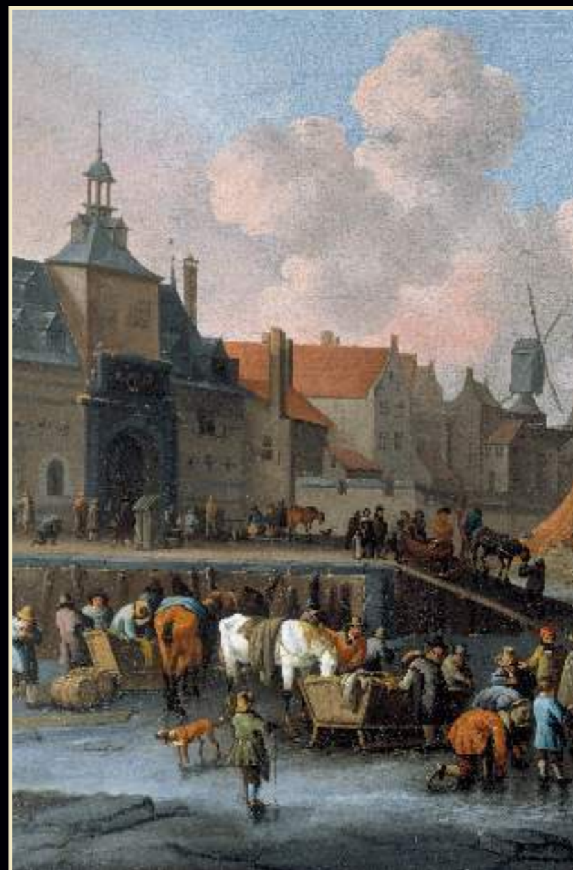
De Oude Ooster Hoofdpoort c. 1660