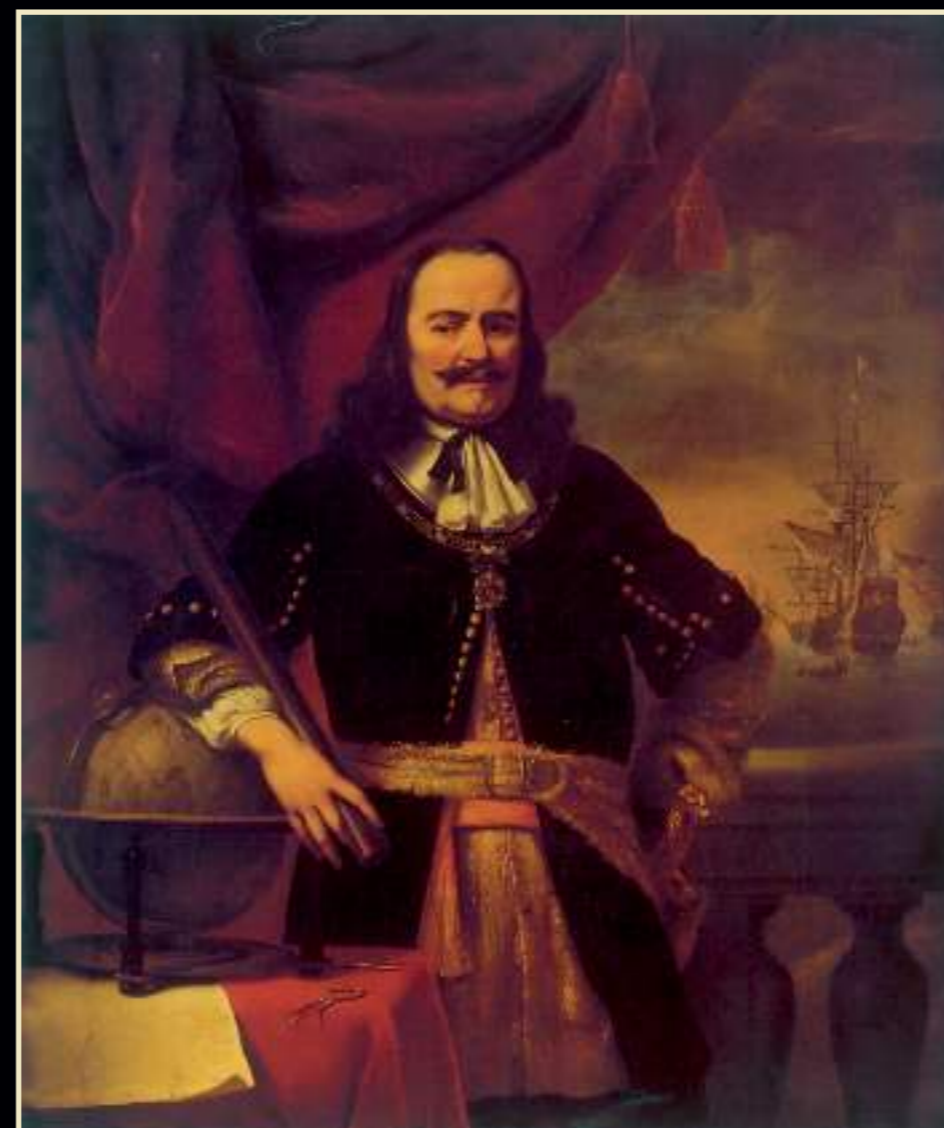
Portret van Michiel Adriaensz. de Ruyter (1607-1676) door Ferdinand Bol. (Nederlands Scheepvaart Museum Amsterdam).