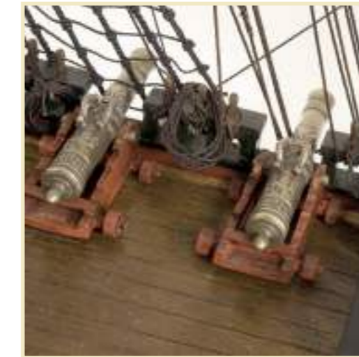
Kanons gegoten met opschrift 'ADMIRALITEIT AEN D. MAES'