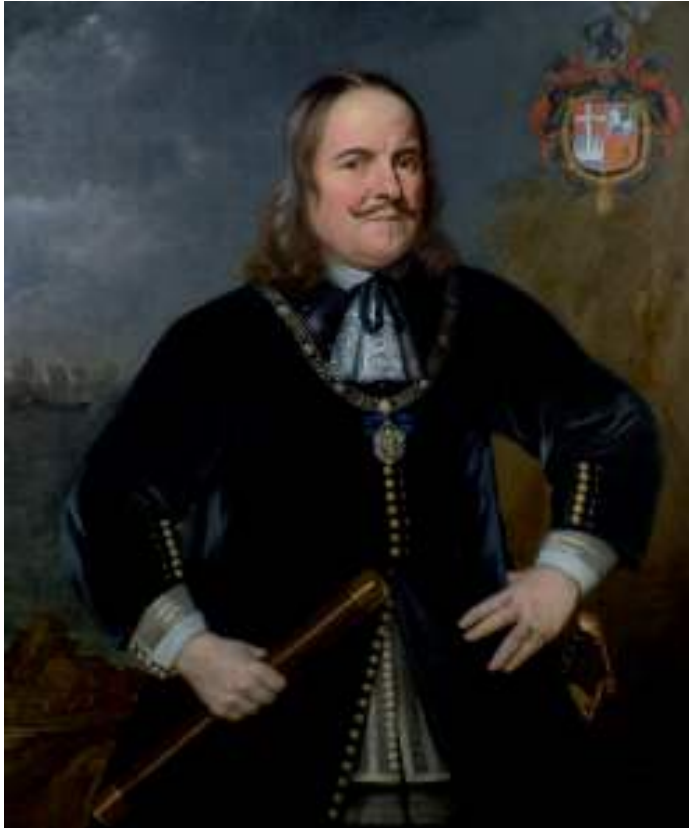
Michiel de Ruyter (1607-1676)