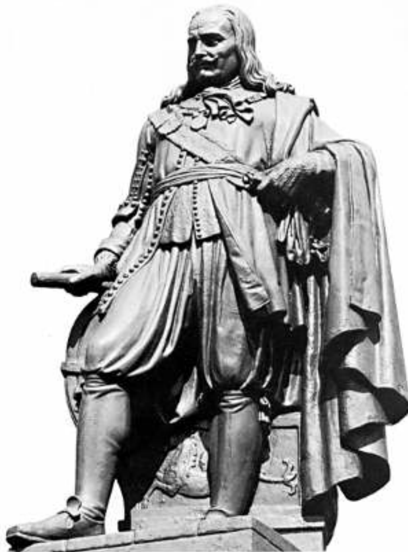
Standbeeld van De Ruyter te Vlissingen