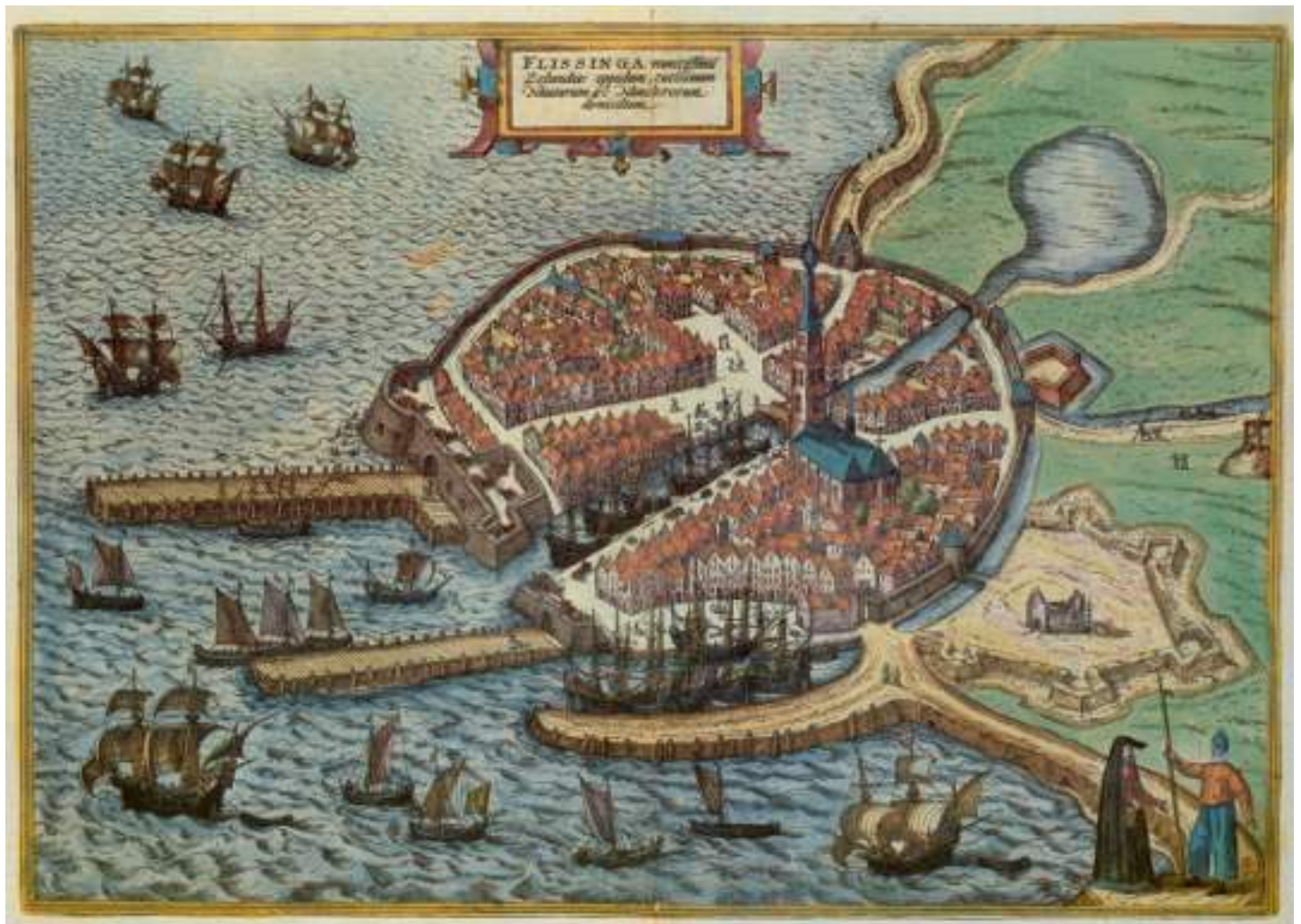
Plattegrond van Vlissingen, 32 x 45 cm. Uitgave Braun-Hogenberg 1576