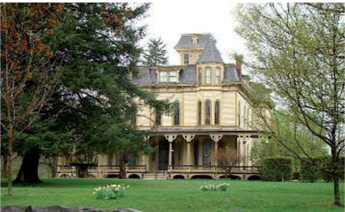
Aanzicht van het Park McCullough House, North Bennington, Vermont

De zeeschilder Hendrik Willem Mesdag (1831-1915)